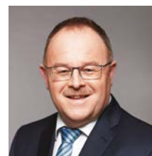
Romain Schneider Ministre de la Sécurité sociale

J'espère que chacun trouvera la mesure adéquate correspondant à ses conditions de vie actuelles et ses besoins futurs.